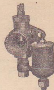
Type "M" (Fixation par bride).