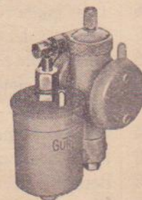
Type "R 17" (Cuve à gauche).

Commandes : Indiquer la marque de la moto et du moteur 2 ou 4 temps, soupapes latérales ou culbuteurs, la cylindrée et le diamètre de la pipe d'admission ou dimension bride moteur.